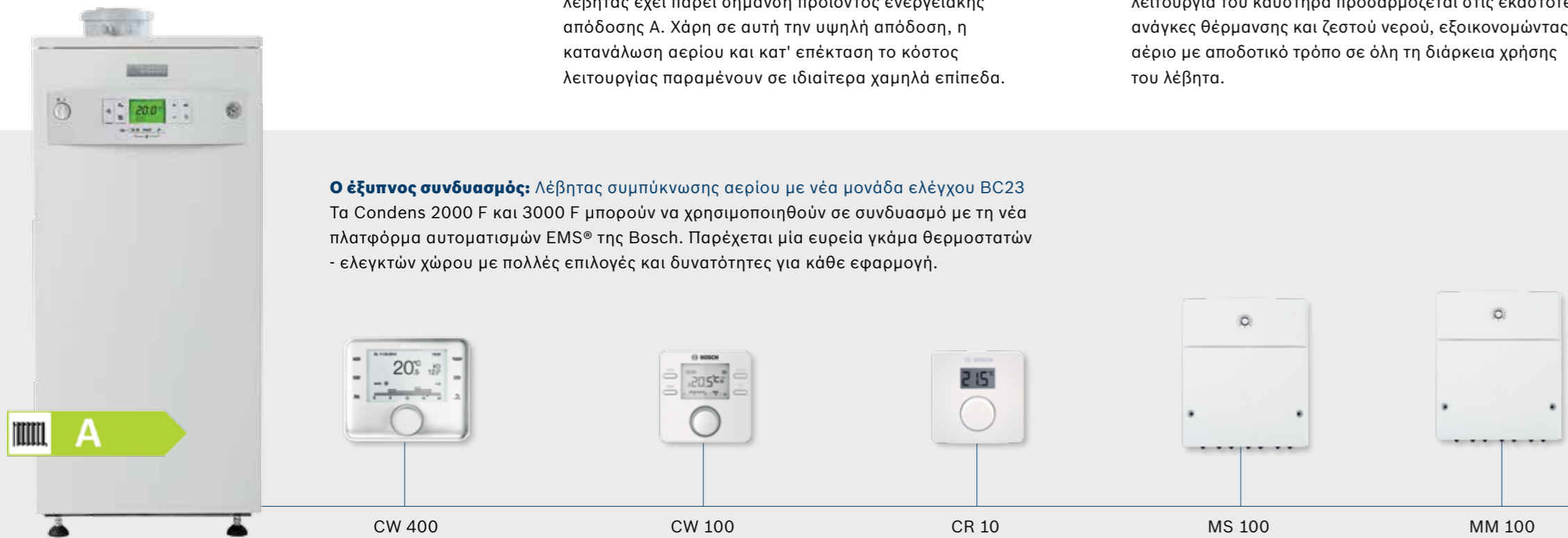
Condens 2000 F και 3000 F

Γρήγορη και εύκολη είναι και η συντήρηση, καθώς όλα τα εξαρτήματα είναι εύκολα προσβάσιμα από εμπρός, όπως και ο καθαρισμός του εναλλάκτη θερμότητας.