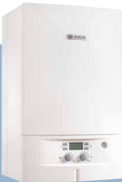
Condens 2000 W

Ο λέβητας συμπύκνωσης αερίου Bosch Condens 2000 W με διεπαφή επικοινωνίας θερμοστάτη τύπου Open Therm (O.T.) παρέχει τη δυνατότητα προσαρμογής λειτουργίας με κυλιόμενη ρύθμιση ανάλογα με τη στιγμιαία ζήτηση θέρμανσης και ελέγχοντας τον ρυθμό αύξησης ή μείωσης θερμοκρασίας στο εσωτερικό της κατοικίας σας. Η συσκευή παράγει ακριβώς τόση θερμότητα όση είναι απαραίτητη, το οποίο εξασφαλίζει σημαντική εξοικονόμηση αερίου, μείωση των απρόσκοπτων εναύσεων και των παραγόμενων ρύπων προς το περιβάλλον, ισοσταθμίζοντας διαρκώς τις ανάγκες σας σε θέρμανση. Με απλά λόγια, όπως λέμε στην Bosch, “Τεχνολογία για ζωή”.